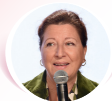
Agnès Buzyn, Ancienne ministre des Solidarités et de la santé