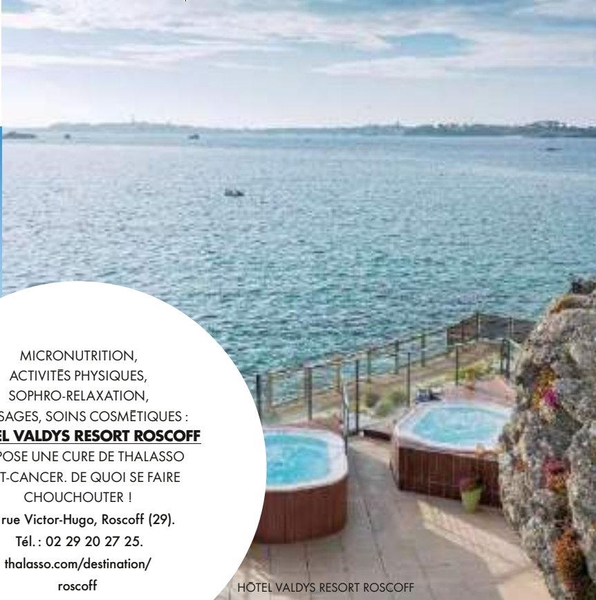
HÔTEL VALDYS RESORT ROSCOFF