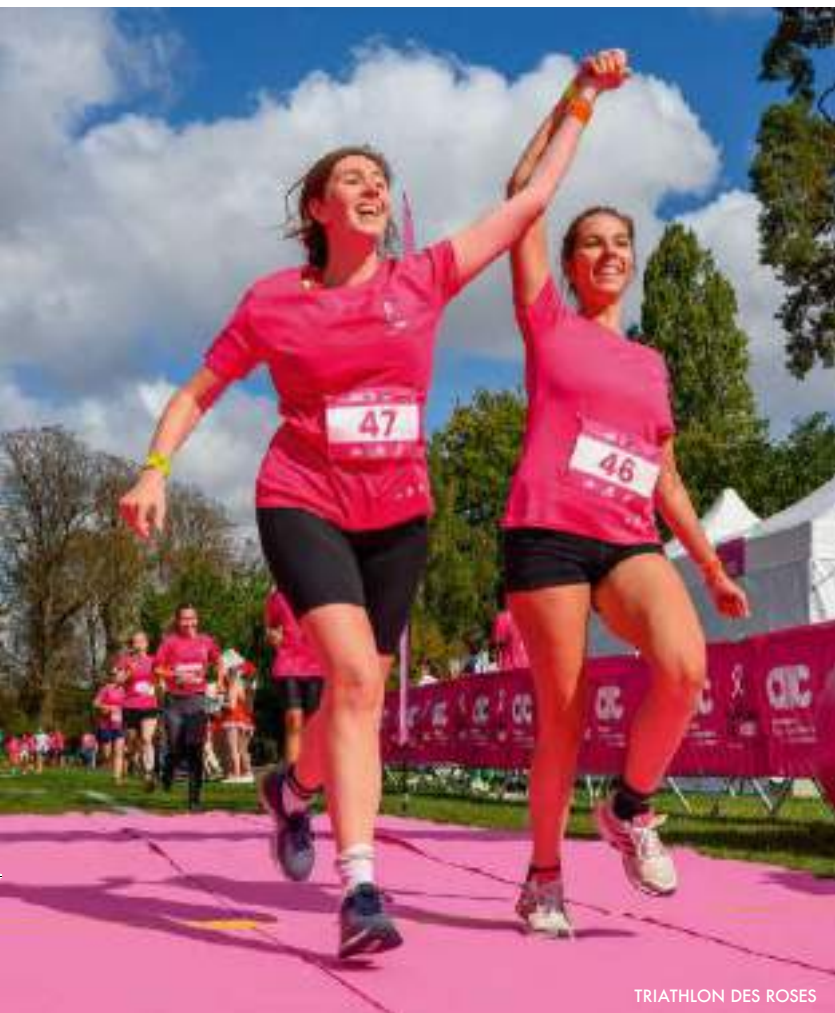
TRIATHLON DES ROSES