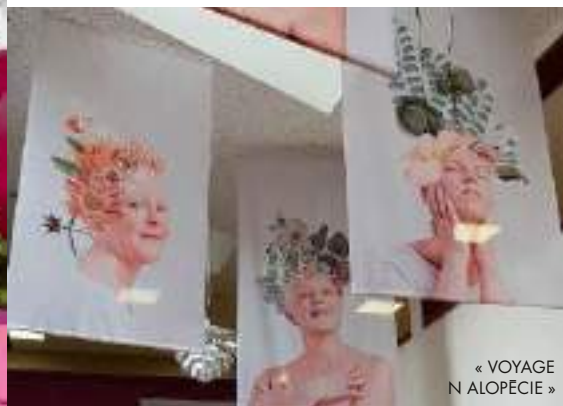
« VOYAGE EN ALOPECIE »

Tél. : 07 69 20 86 44. kocoonensembleautrement.fr