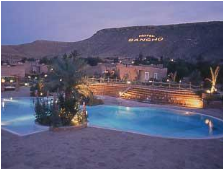
Hôtel Shango TATAOUINE