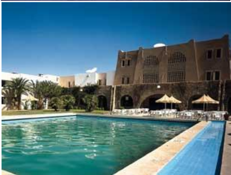
Hôtel Méhari DOUZ