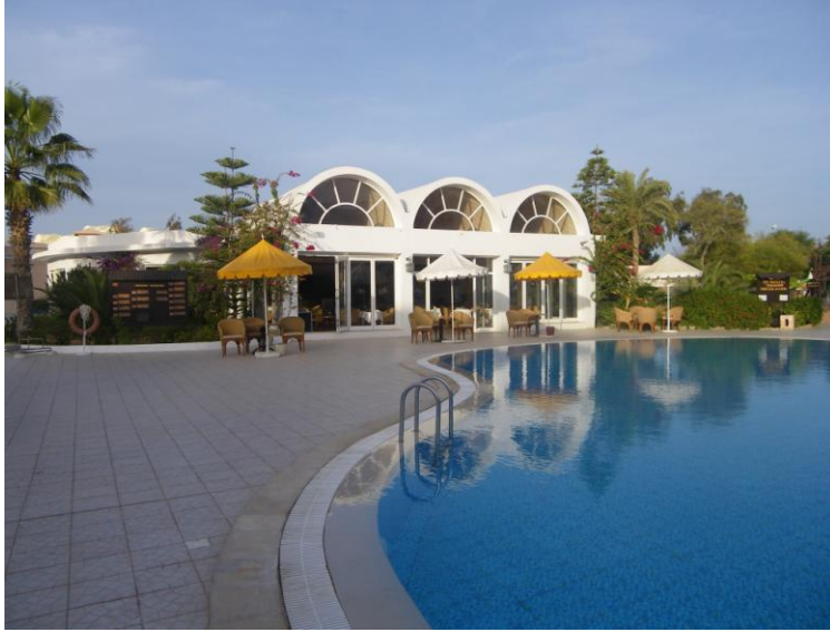
Hôtel ISIS DJERBA