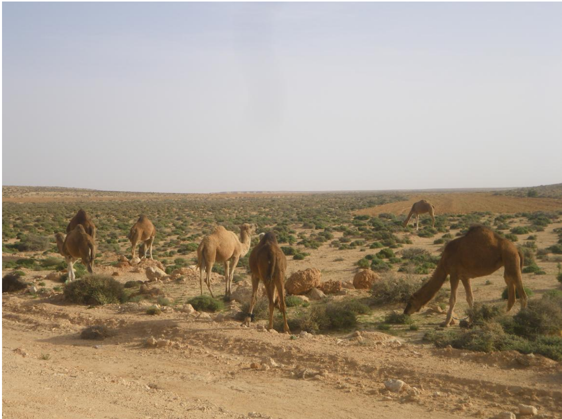
Photo du 2 décembre 2010 réalisée pendant la reconnaissance du raid 2011